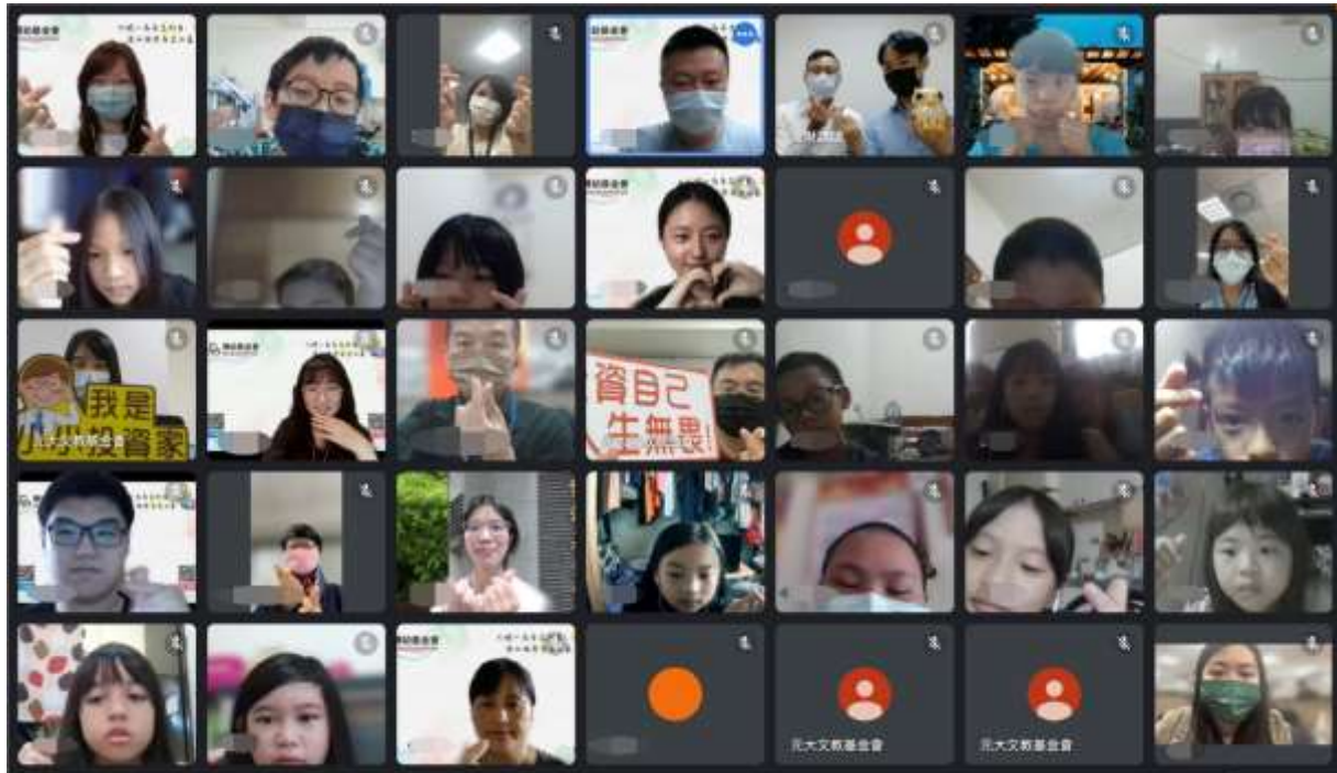
圖 1：元大講師透過線上教學，帶領偏鄉學童智慧理財。

用下班時間齊聚線上，透過歷屆理財講師的培訓與經驗交流，共同帶給偏鄉學生優質的理財課程，也為下半年的元大理財日活動預作暖身。